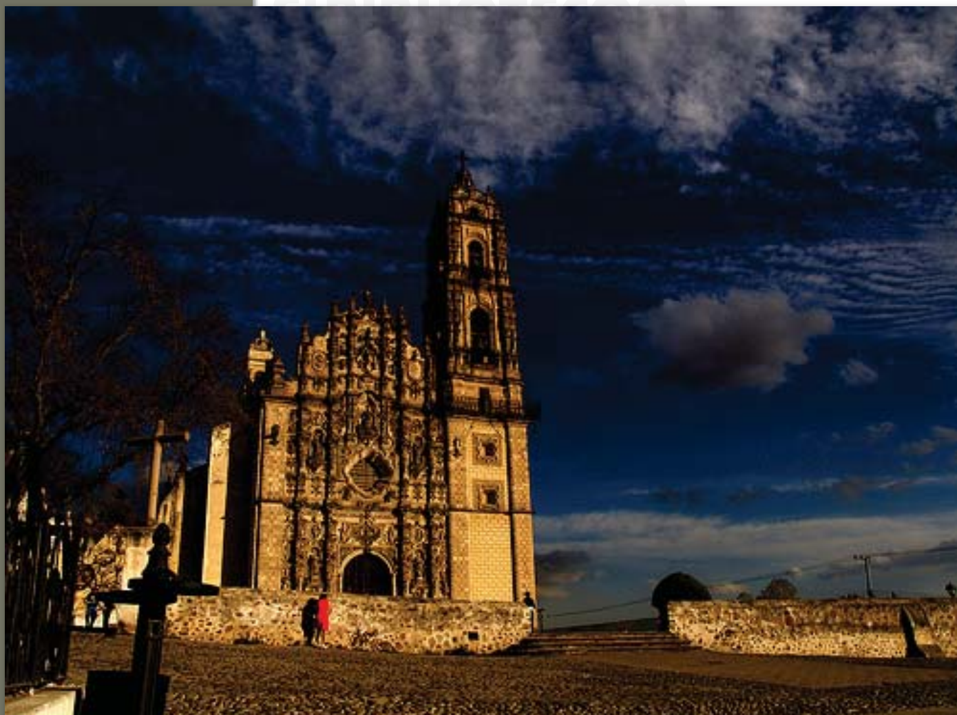
Catedral de Tepetzotlan

Si bien los primeros en llegar a evangelizar la región fueron de la orden Franciscana en el siglo XVI, la impresionante estructura arquitectónica que se creó con el objetivo de albergar al Colegio de San Francisco Javier fue llevada a cabo por los Jesuitas, aquellos que precedieron la misión. La tarea realizada aquí por los jesuitas fue de tal importancia hasta su expulsión en 1767, que incluso volvió a funcionar cuando a los miembros de esta orden se les permitió volver a México. El abandono definitivo de esta construcción fue llevado a cabo en 1914 y, en la actualidad, alberga al Museo Nacional del Virreinato.