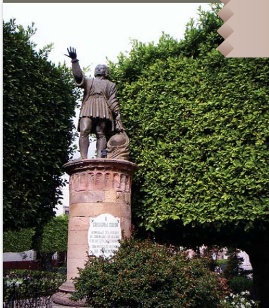
Monumento a Cristóbal Colón