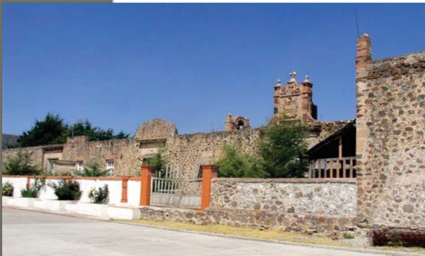
Hacienda de Tepetitlan

En esta hacienda, las relaciones con el medio natural fueron cortantes, ya que consistía en un micromundo cerrado, vueltos hacia si mismos y a menudo autosuficientes. Frondosos árboles bordean la calzada que da acceso a la puerta de campo como forma de anunciar la proximidad de la finca y de ir atenuando la diferencia de espacios.