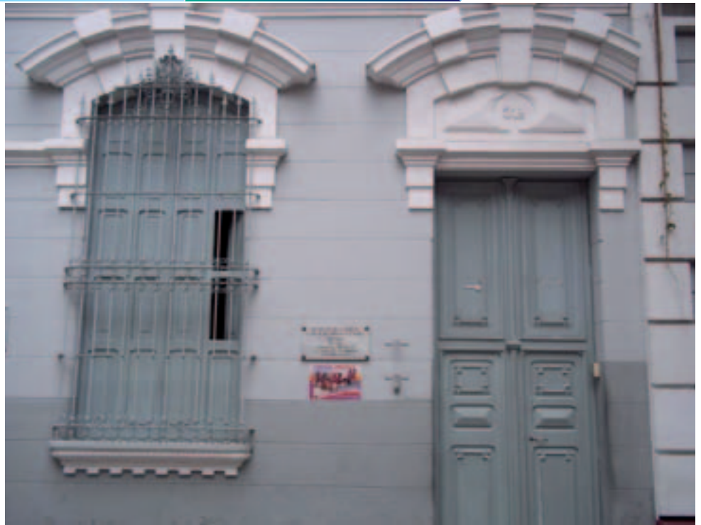
Entrada Casa Nuestra América "José Martí".