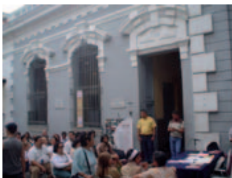
Actividades en la Casa José Martí.