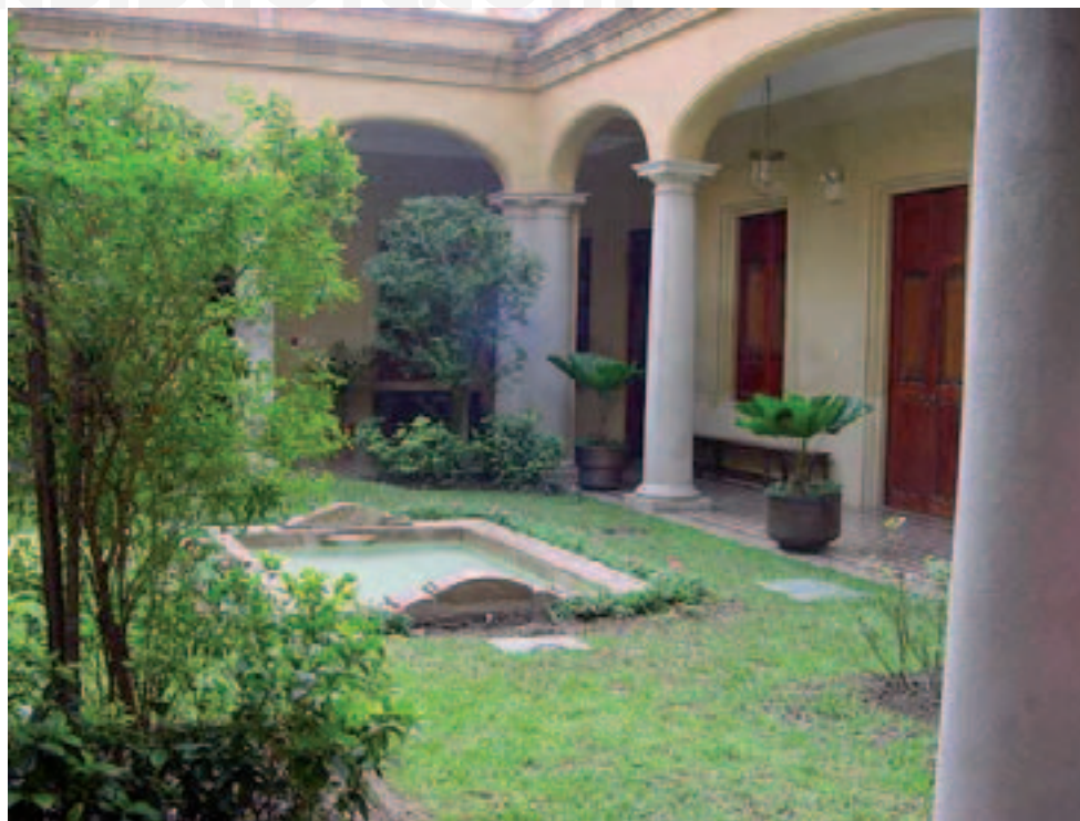
Casa del estudio de la Historia de Venezuela.