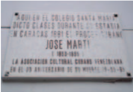
Detalle de la placa de entrada. Casa J. Martí.