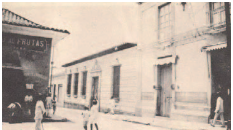
Fachada y alrededores de la Casa natal del Libertador, año 1919.