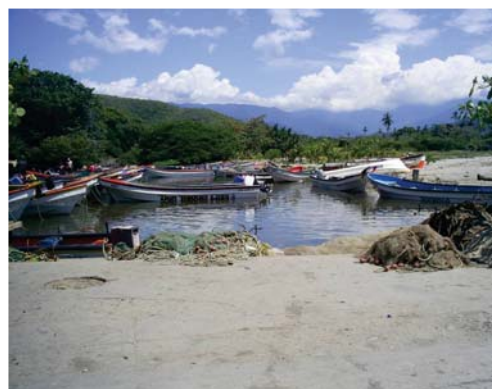
La Boca de Ocumare de la Costa y Puerto Maya.

El camino a tomar para arribar a Ocumare de la Costa es la autopista regional del centro hasta la salida El Limón, siendo ésta uno de los accesos a Maracay. Desde allí, se debe continuar derecho y pronto se encuentra la primera señalización de Ocumare. Irse desde Ocumare hasta la Costa también resulta sencillo y el camino está bien señalizado. Así también, la carretera que une estos lugares está en mejores condiciones y es más ancha que la vía que conduce hacia Choróní. En líneas generales, esta región cuenta con menos desarrollo turístico que la zona de Puerto Colombia y Choróní.