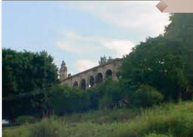
Vista de La Hacienda La Goleta