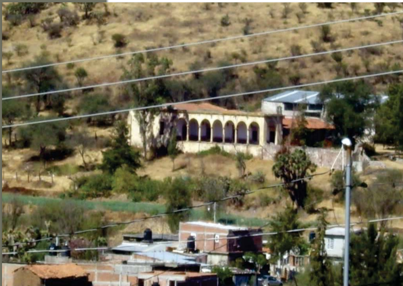
Hacienda La Goleta en la actualidad