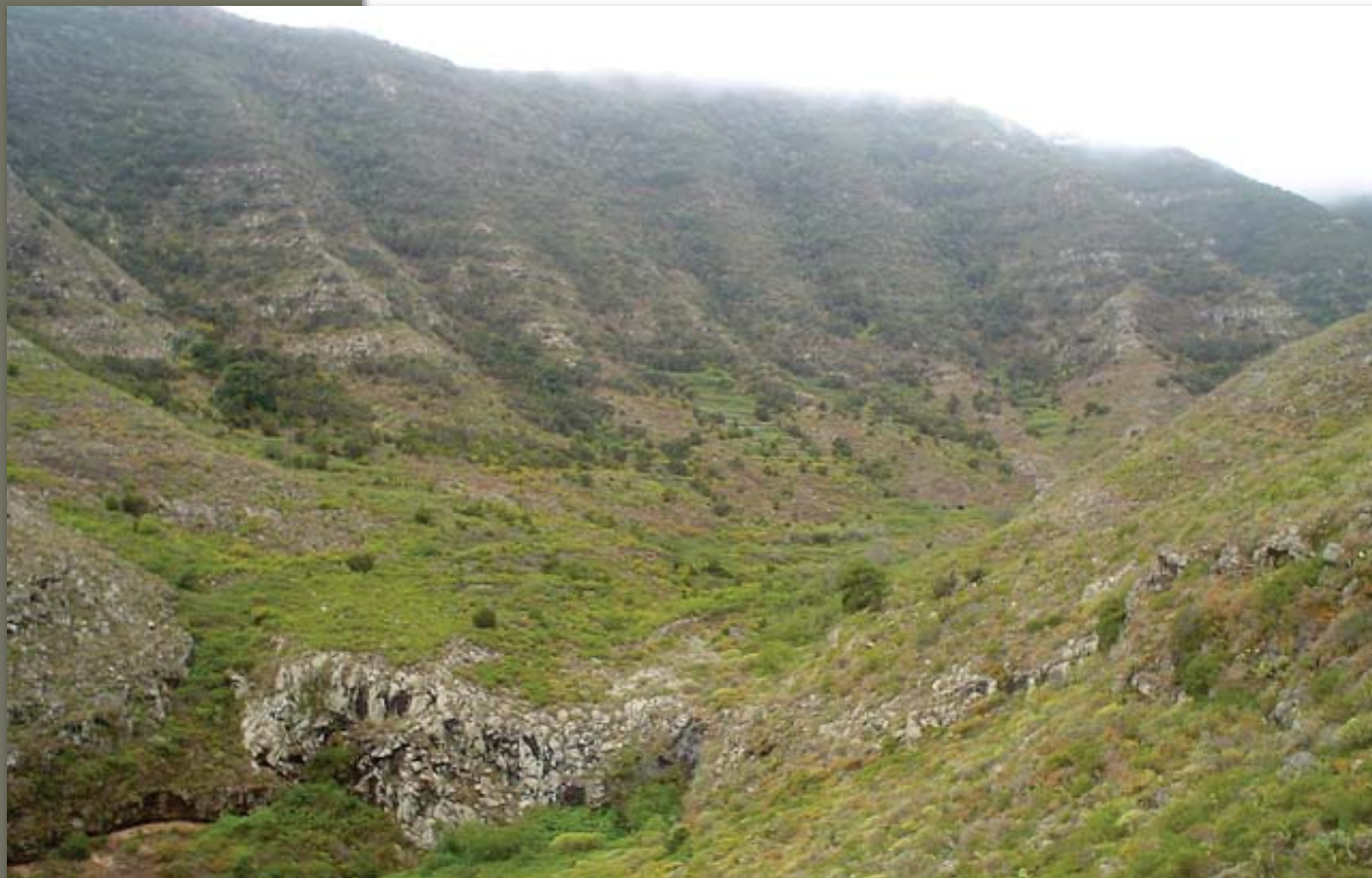
El Valle de La Goleta, donde se encuentra La Hacienda

Poco queda de lo que fue una floreciente y magnífica hacienda, actualmente convertida en ruinas.