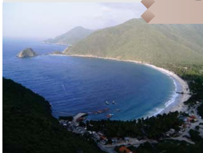
Arriba y Centro: Bahía de Cata.

La belleza de esta bahía resulta ser tan impactante que para poder apreciarla en su plenitud, es recomendable detenerse en la carretera antes de llegar y dedicar unos instantes a contemplar este inolvidable y majestuoso espectáculo. La Bahía de Cata es una inmensa bahía urbana de 800 metros de largo por 35 de ancho. Está bordeada de edificios altos y palmeras. Sus arenas son blancas y, usualmente, el oleaje de sus aguas es moderado. La Bahía de Cata tiene grandes atracciones y comodidades para los turistas, tales como alquiler de sillas y sombrillas, servicios de salvavidas, un amplio abanico de cafetines y restaurantes, venta de artículos de playa, paseos en lancha o banana y, ubicándose a lo largo de la playa, un gran estacionamiento protegido que tiene un costo de 3000 bolívares por día. Además, la Bahía de Cata cuenta con un área de camping con instalaciones sanitarias y un muelle para embarcaciones. Finalmente, cabe señalar que lo que completa la descripción de esta preciosa bahía es su ambiente, siendo éste alegre y amistoso, recibiendo a los turistas con gran hospitalidad y calidez.