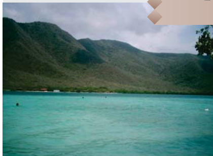
La Ciénaga de Ocumare..

es necesario llevar todo lo pertinente para la estadía, incluyendo sombrilla y protector solar, ya que la playa no cuenta con ningún tipo de infraestructura turística. Sin embargo, este destino resulta ideal para quienes desean disfrutar de algunos días lejos de la civilización, disfrutando y descansando en un verdadero paraíso natural.