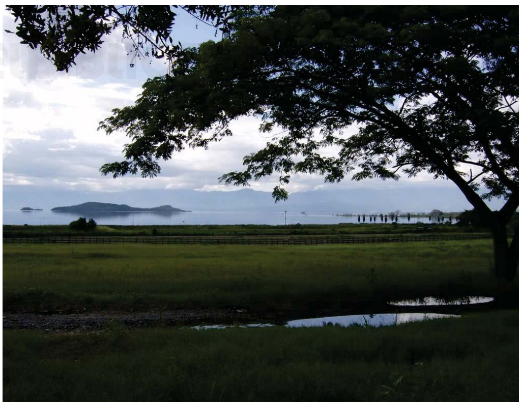
Zona Sur del Lago de los Tacariguas.

Desplazándose hacia las afueras de Maracay se puede observar a la Plaza Tacarigua, estando ésta ubicada en la Base Sucre. Gracias a su valor histórico y escultórico, esta plaza es un lugar de gran interés cultural y turístico. Este espacio fue mandado a construir por el General Gómez a modo de recordatorio de los pueblos originarios que vivían en las riberas del lago de Los Tacariguas. También conocido como Lago de Valencia.