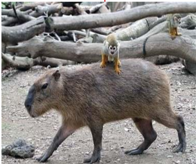
Capibara o rensoco con un mono araña subido a su lomo

En la amazonia peruana se han clasificado cerca de 800 especies de peces. Los principales son el paiche, el zungaro, la doncella, las carachamas, etc. Entre los peces con características especiales están la anguila eléctrica (que paraliza a sus presas con descargas eléctricas) y el canero (parasito de las agallas de los peces que puede introducirse en las uretras de los humanos).