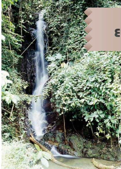
Arriba y Centro: Parque Nacional Henri Pittier.