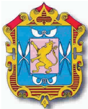
Escudo del Departamento de Amazonas