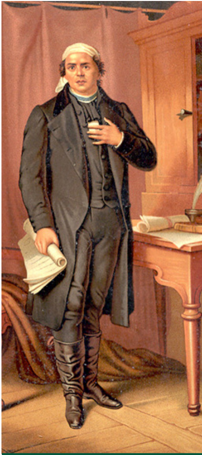
Arriba: José María Morelos. Abajo: Gertrudis Bocanegra.