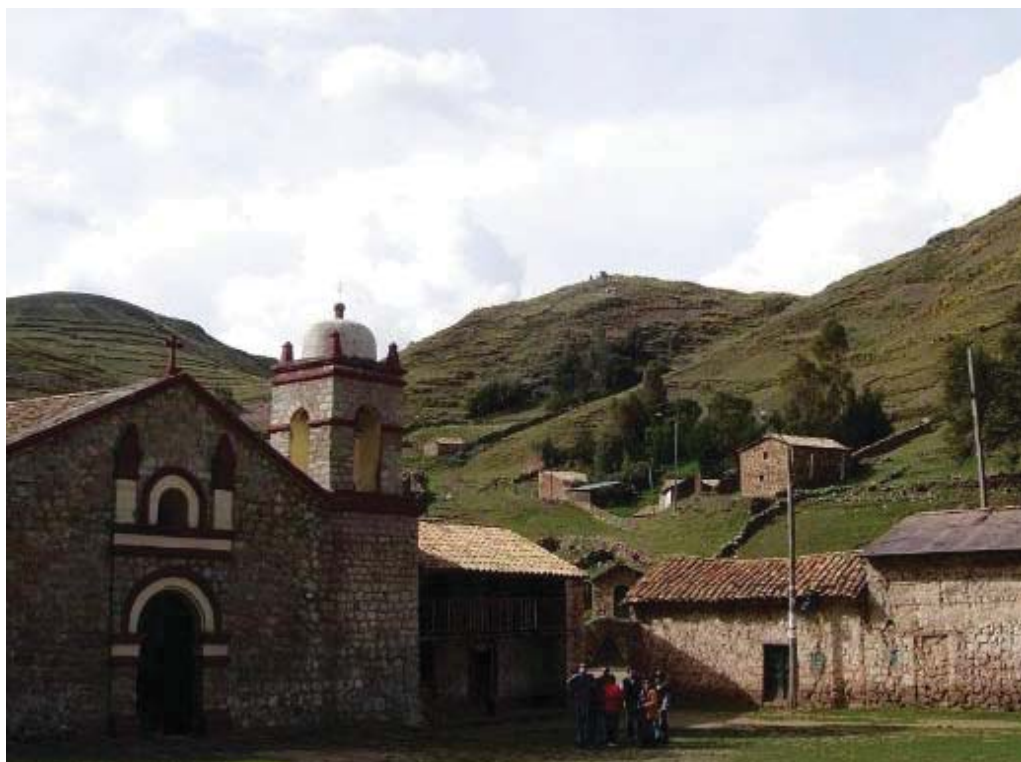
Iglesia y plaza de Sacsamarca

La ciudad de Huancavelica cuenta con atractivas iglesias coloniales del siglo XVII como Santa Ana, Santo domingo, San Francisco, La Ascensión, San Cristóbal y San Sebastián.