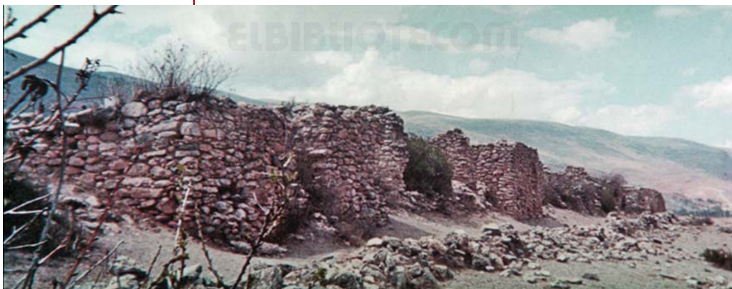
Ruinas de Arwataro

En este departamento se encuentra la Reserva Nacional de Junín, que comprende la Pampa y el Lago Junín, así como el Bosque de Rocas de Huayllay.