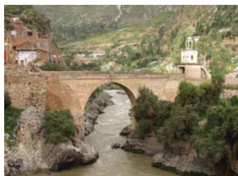
Aldea de Huancavelica

Cuenta con museos, iglesias, plazas, ruinas pre-incas e incas, nevados, lagunas y centros artesanales. El Convento de Santa Rosa de Ocopa es el más antiguo y completo del Perú. Fue fundado en 1725 y tuvo un rol importante en la evangelización de la Amazonía Peruana. El Monasterio consta de 4 claustros que guardan cuadros de la Escuela Cusqueña y tallados en Piedra de Huamanga.