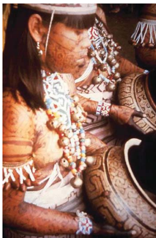
Nativa de la zona

Durante las siguientes dos década numerosos aventureros y comerciantes explotaron los bosque a lo lato de la nueva ruta, encontrando abundante caucho y oro. Llama la atención que recién a partir de 1915, ante la persistencia de los misioneros dominicos, las tribus locales empiezan a aceptar la civilización. No obstante, todavía hoy existen grupos en total aislamiento físico y cultural.