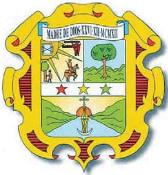
Escudo de Madre de Dios

Existen indicios de la presencia de seres humanos antes de la conquista y el surgimiento del imperio incaico, ya que se han encontrado restos antiquísimos como los petroglifos en los ríos de Palotoa, Shinkebenia y Urubamba. En la cordillera de Pantiacolla, en las cabeceras de Madre de Dios, también hay petroglifos y restos antiguos que atraen a los arqueólogos.