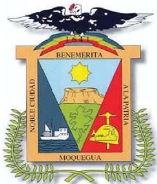
Escudo de Moquegua

Se estima que alrededor del año 1540 llegaron los primeros españoles en busca de tierras para establecerse. Uno de los trece de la isla del Gallo, Juan de la Torre, capitaneó la expedición que inició la dominación española en la villa situada entre las montañas Huaynaputina y Tixan. Asentada en plena región volcánica, la ciudad ha sufrido numerosos temblores y terremotos, como el de 1604 que destruyó gran parte del área urbana.