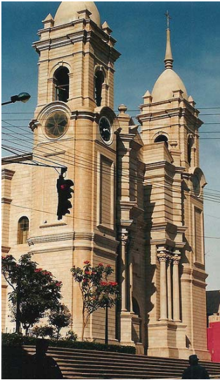
Catedral de Moquegua

La región en que se asienta este departamento era ya conocida y poblada desde antes de la llegada de los Incas y a sus pobladores primitivos se les atribuye la denominación de Moquegua, nombre que en quechua significa "lugar silencioso". Fue el Inca Mayta Cápac el que organizó la expedición militar imperial que extendió el dominio de los monarcas cusqueños hasta esta parte del litoral.