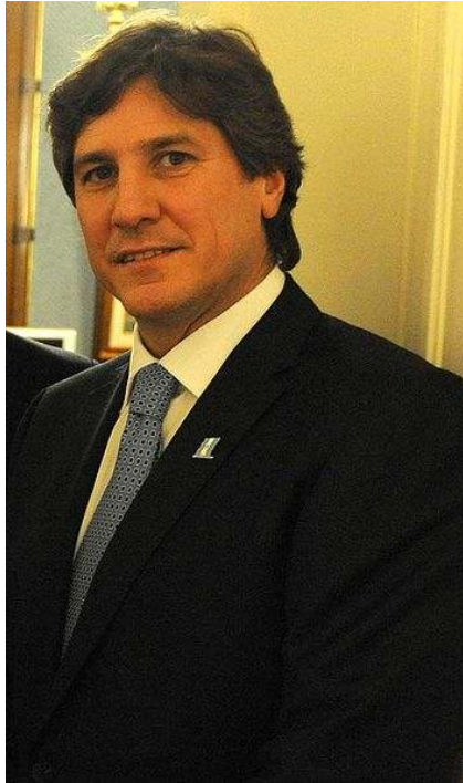
Amado Boudou, ministro de economía.