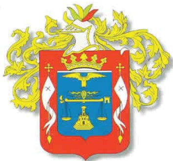
Escudo de Piura

El Imperio de los Incas, con Túpac Yupanqui, inició la conquista de la región sometiendo a los Ayahuacas y a los Huancapampas, que habitaban las regiones que forman hoy las provincias de Ayabaca y Huancabamba.