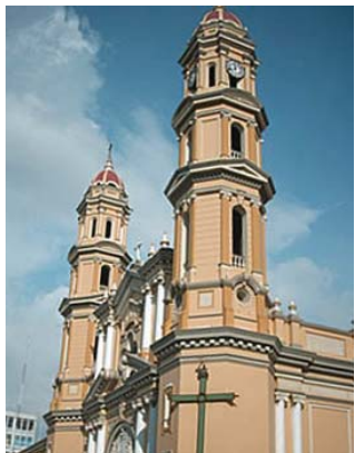
Catedral de Piura

Son muchos los hijos de Piura que han dado prestigio al Perú. Entre ellos están los pintores Ignacio Merino y Luis Montero, el poeta Carlos Augusto Salaverry, el Padre de la Medicina José Cayetano Heredia, el escritor López Albújar y el Héroe de Angamos, Miguel Grau.