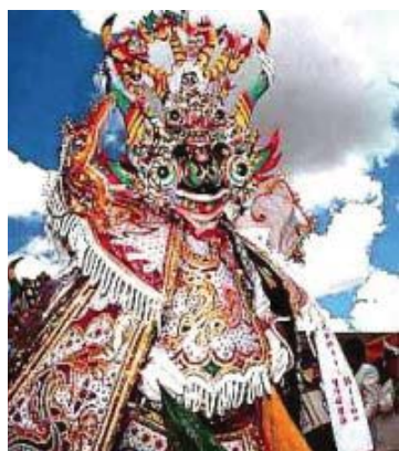
Traje de festejo de Puno

Los aymaras collas a su vez, fueron invadidos por los incas, aunque opusieron una tenaz resistencia, terminaron siendo arrasados y expulsados por los cusqueños. En estos sitios que fueron despoblados, los incas ubicaron a los mitimaes de habla quechua, mientras que los collas fueron arrinconados en las provincias de Moho y Huancané. Surge entonces la leyenda, de que del gran lago Titicaca emergieron el primer inca Manco Cápac y su esposa, Mama Ocllo, para fundar el Tahuantinsuyo.