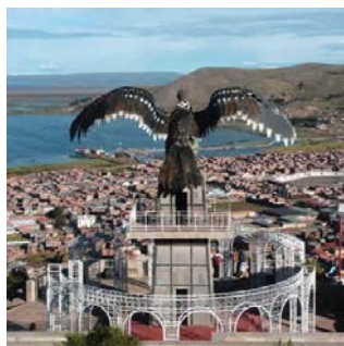
Ciudad de Puno

Puno fue sede del movimiento de la civilización altiplánica del Titicaca, donde se organizó el más antiguo centro urbano de esa región llamado Pucará, con una arquitectura monumental, escultura y cerámica valiosa. Allí culminó toda la etapa previa de domesticación de plantas y animales altoandinos y se forjó lo que sería luego la civilización de Tiahuanaco.