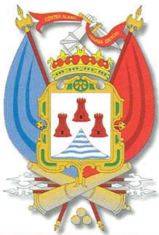
Escudo de Puno

Los pobladores de la cultura Pukara, tuvieron una agricultura muy tecnificada, con sistemas de irrigación de elevado nivel tecnológico, domesticaron plantas, animales y contribuyeron con la tecnología de los andenes, las qochas, los waru warus, la tecnología del frío y sobre todo el aporte a la cosmovisión andina con el hombre de los báculos, llamado posteriormente Wiracocha.