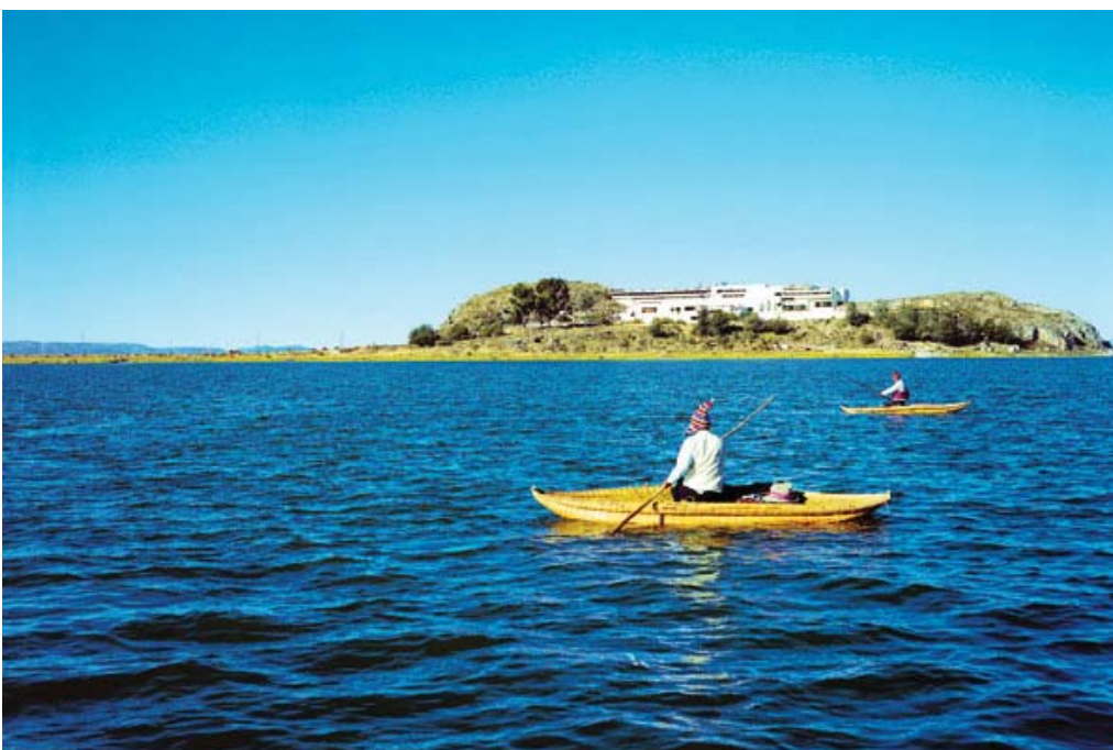
Lugareños del lago Titicaca en sus botes artesanales.