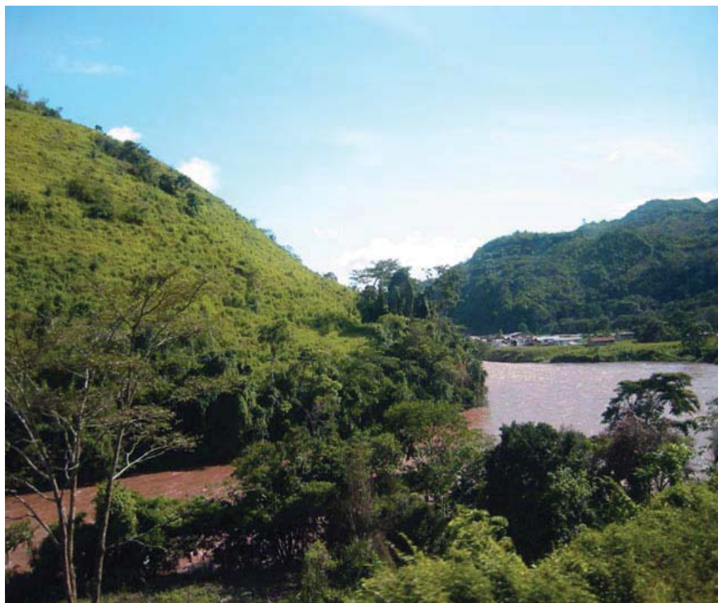
Laguna de Yacumama en Rioja, provincia de San Martín

Túpac Yupanqui penetró y sometió al dominio Inca la apartada provincia actual de Moyobamba, conocida entonces con el nombre indígena de Muyupampa. En 1,839, el español Alonso de Alvarado llega al Río Mayo y funda una ciudad a la que denomina Santiago de los Valles de Moyobamba, que fue más tarde capital de Maynas. Figura de gran trascendencia es también el Padre Manuel Sobreviela, que entre 1787 y 1790 efectuó viajes a lo largo del Huallaga y como resultado de los mismos, publicó un mapa al que llamó "Plan del curso de los Ríos Huallaga y Ucayali y de la Pampa del Sacramento".