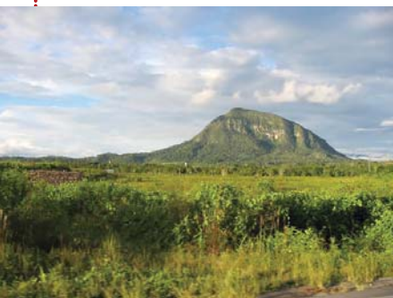
Morro de Calzada. Moyobamba

En Rioja se pueden visitar la Cueva de los Huácharos; El Santuario de las Amazonas, junto a la quebrada de Aguas Claras (posee abundantes estalacitas y estalagmitas que embellecen su aspecto); la laguna de San Fernando y el balneario San Juan de Urifico. En Tarapoto, conocida como la Ciudad de las Palmeras, vale la pena conocer los petroglifos de Polish, con figuras de animales y plantas; el balneario Combaza; las bellas cataratas de Ahuashiyacu y Huancamaillo, además de las lagunas de Venecia y Azul. En la provincia de Mariscal Cáceres se encuentra el Parque Nacional Abiseo, que protege a una gran variedad de especies en peligro de extinción. Además, la apacible laguna El Sauce; el hermoso pongo de Aguirre; y el río Huallaga.