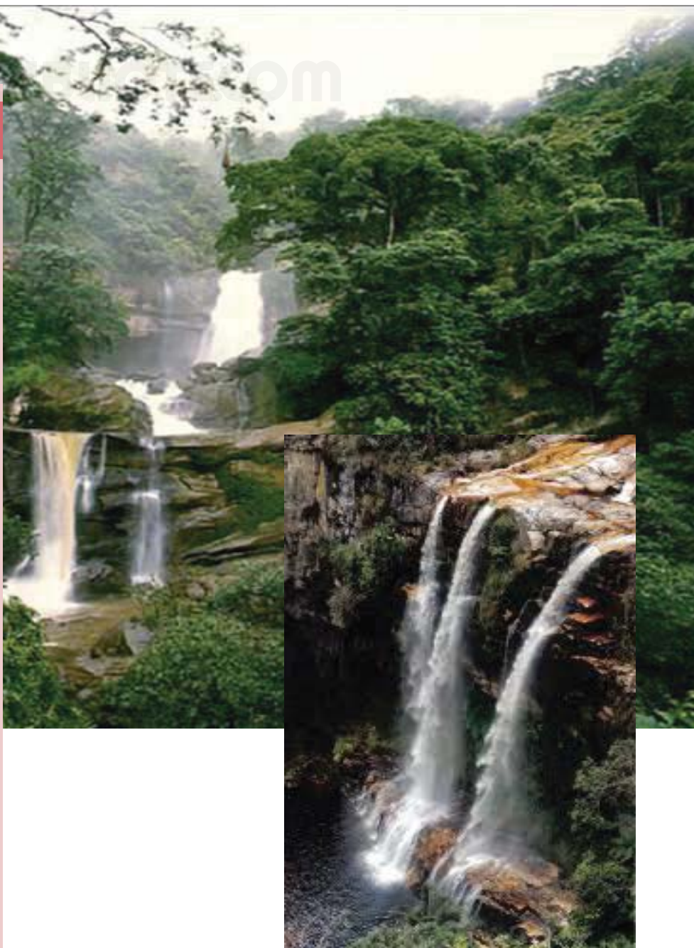
Cataratas del Gera

A 21 km al sureste de la ciudad de Moyobamba, rodeadas de una densa vegetación intocada por el hombre, se observa el agua caer con fuerza en tres etapas, desde una altura de 120 metros.