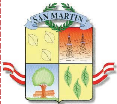
Escudo de San Martín

Posteriormente, desde mediados hasta fines del siglo pasado, la producción y exportación de sombreros de paja bombonaje o toquilla permitieron a San Martín disfrutar de un auge económico, con la apertura de numerosos negocios locales. Este hermoso y acogedor departamento fue creado en 1906 para honrar la memoria del héroe libertador don José de San Martín. Con la construcción de la Carretera Marginal de la Selva, en la década de los años sesenta, se logró la importante conexión terrestre con el resto del país.