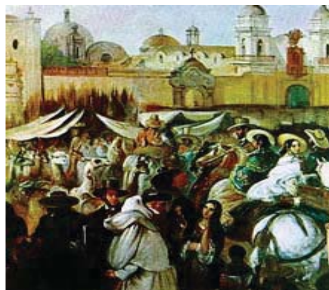
Lima a principios del siglo XIX