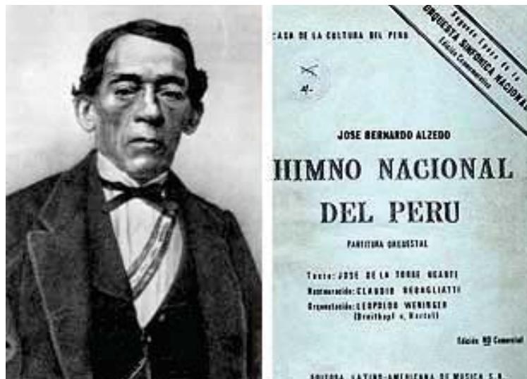
Alcedo y su obra: El Himno Nacional del Perú

Dicha iniciativa, aún cuando fue aprobada, no prosperó, debido al rechazo que generó en la opinión pública por el arraigo y el reconocimiento que el tiempo le había dado, haciendo de ella una tradición ya consolidada.