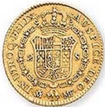
Doblón español de la época de las colonias

ALCABALA: gravaba todas las transacciones de bienes (sin perjuicio del almojarifazgo), es comparado con el impuesto general a las ventas. El vendedor estaba obligado a pagarlo, se exceptuaban instrumentos de culto, medicinas, el pan, etc.