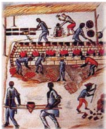
Ilustración que muestra la minería en Perú y las aplicaciones taxativas

ANNATA: impuesto aplicado a las rentas generadas por ocupar cargos de diversa índole, se calculaba en función de las ganancias obtenidas en un año.