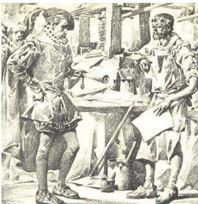
Grabado que muestra a un cobrador de impuestos de la época de las colonias

DERRAMA: contribuciones que daban a la corona los súbditos cuando aquella se encontraba en guerra.