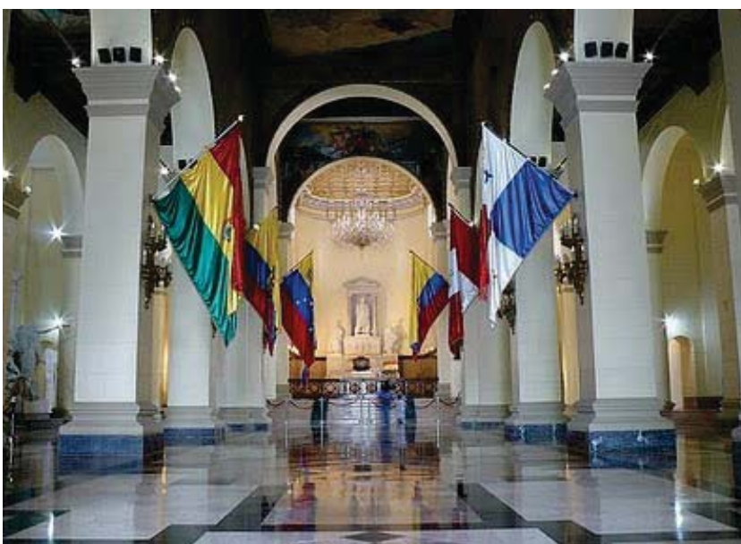
Tumba de Simón Bolívar, en Venezuela

Túpac Amaru es derrotado y ejecutado pero dejó encendida la llama de la revolución americana que se avivó más y más y culminó más tarde con la independencia de las naciones colonizadas.