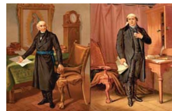
Morelos e Hidalgo, patriotas mexicanos

Se manifestó por la reforma de las Universidades, la creación de centros de cultura superior, el estudio de ciencias nuevas que sobre todo tendrían que ver con el convencimiento de nuestra realidad y desarrollo socio-económico.