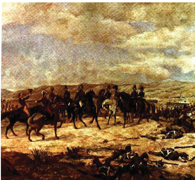
Batalla de Ayacucho, el fin de la dominación