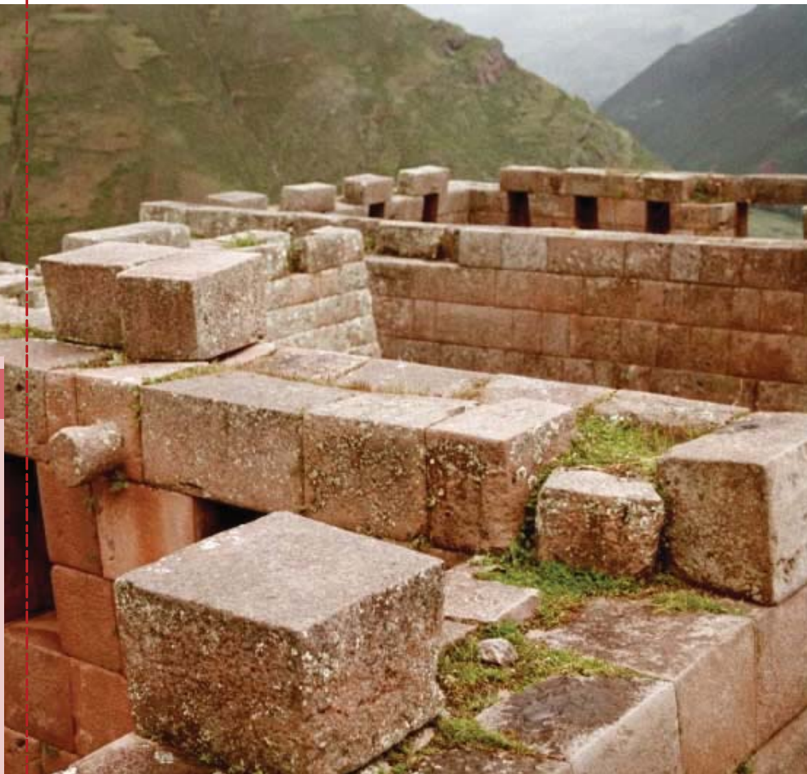
Antigua construcción incaica

Un ejemplo de esta arquitectura se encuentra en Sacsayhuaman, que es una fortaleza muy grande con varios bloques de piedra.