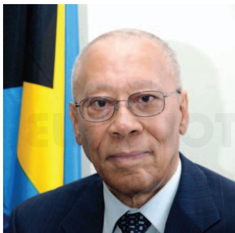
Sir Arthur Foulkes.

Fue nombrado Gobernador General, el 1 de febrero de 2006 por la Reina Isabel II de Bahamas. La decisión fue apoyada por el Primer Ministro Perry Christie.