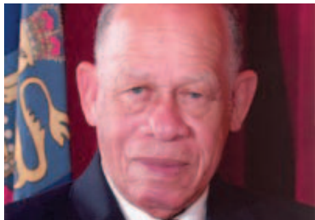
Arthur Dion Hanna.

Estudió leyes y consiguió ser una figura respetada dentro de su ámbito de trabajo. Fue nombrado Gobernador general en el 2005 y ocupó durante un año ese puesto.