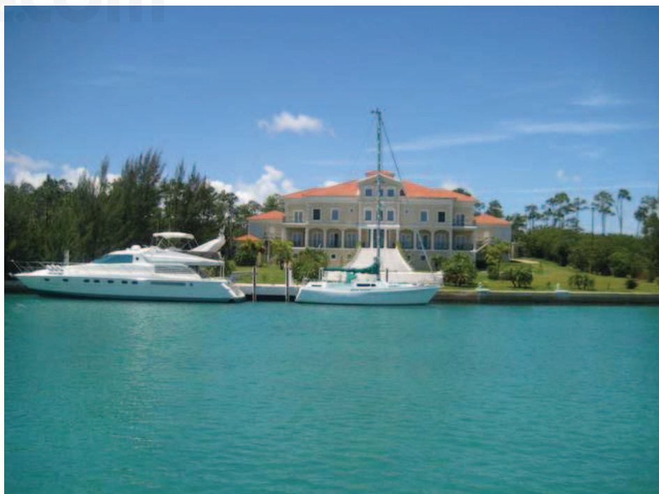
Pine Ridge, Gran Bahama.

Tuvo diferentes empleos relacionados a la contaduría, prestó sus servicios al Departamento de Owens-Illinois Sugar Mill Company en Abaco, a la Corporación de Telecomunicación de Bahamas y al Banco Chase Manhattan de Nassau. Se convirtió en un asistente de ley articulado y en 1972 fue llamado por el Tribunal de Bahamas. Dentro del ámbito privado fue socio principal de la firma Christie, Ingraham & Co.