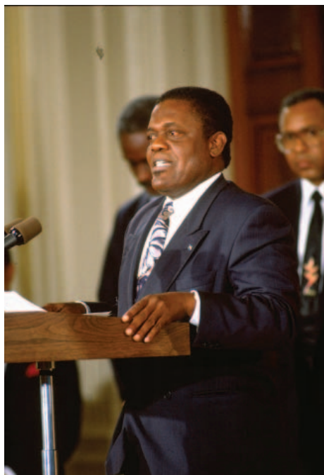
Hubert Alexander Ingraham.

Se retiró de la política en el año 1997.