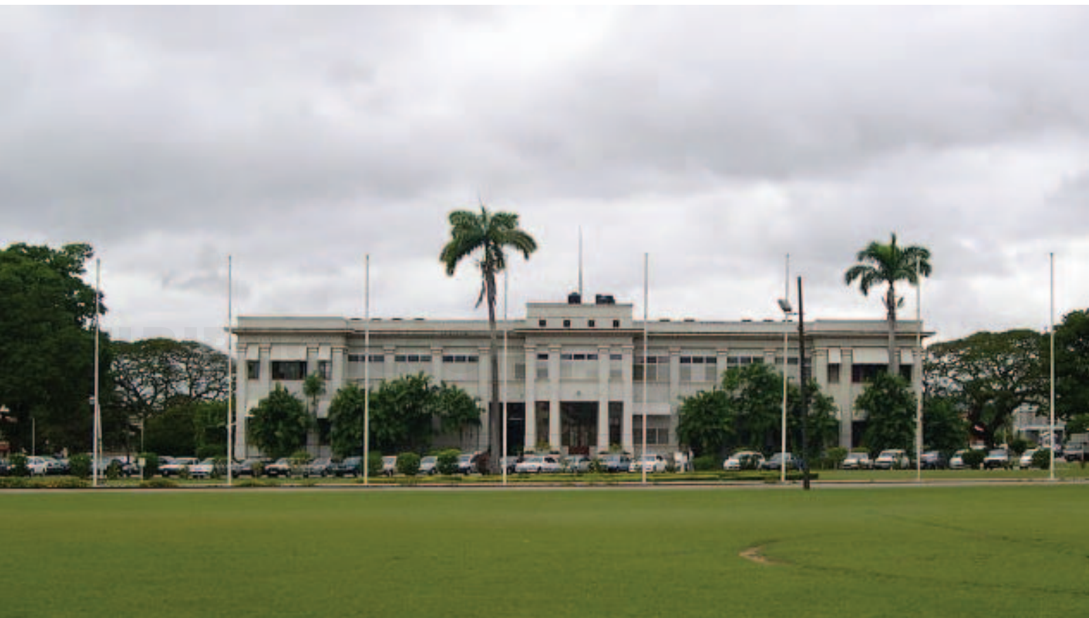
West Indies University.

Sus habilidades administrativas beneficiaron la Liga Progresista, en la misma se desempeñó como Secretario General y creo una sección económica de registros. En 1944, fue nombrado miembro del Comité Ejecutivo.