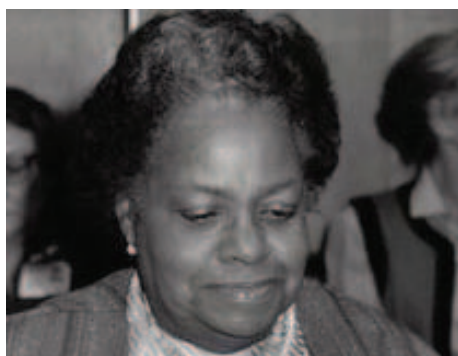
Dame Nita Barrow.

En 1946, se hizo responsable de la educación, del Departamento Jurídico, de la Agricultura y la Pesca. En 1947 renunció de la Liga y asumió funciones como Secretario de la Universidad de West Indies en Jamaica.