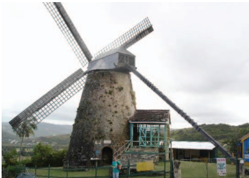
Morgan Lewis Plantation.

Nació el 5 de agosto de 1926 en Morgan Lewis Plantation. Los estudios primarios los cursó en la Escuela Elemental Selah en Santa Lucía entre 1931 y 1936. Los grados de la secundaria los realizó en la Escuela Parry en el Harricon entre 1936 a 1946. Fue maestro en la Escuela Parry durante tres años.