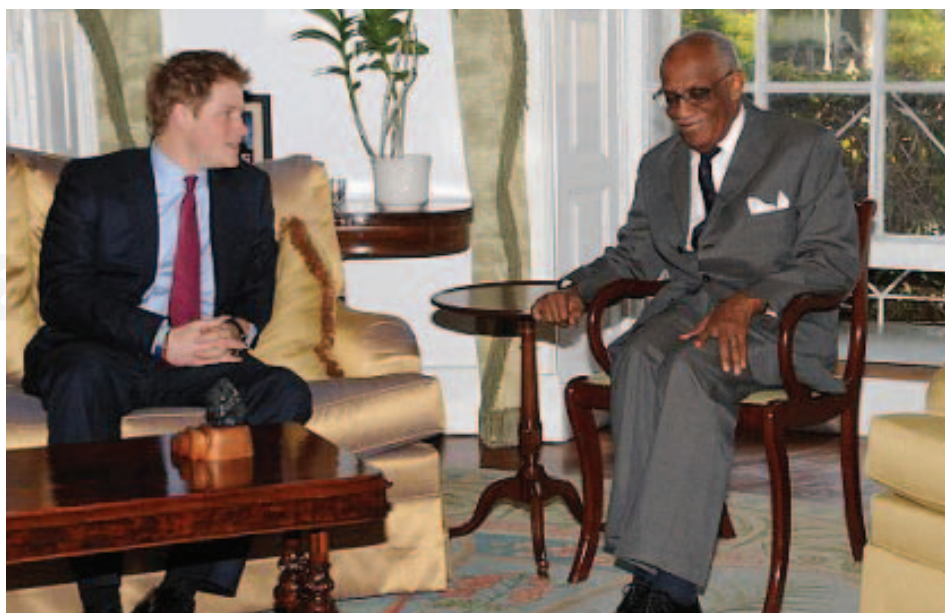
Junto al príncipe Harry.

Lo nombraron Juez de la Corte Suprema en 1976 y en 1991 fue promovido al rango de Juez de Apelación. También actuó como Presidente del Tribunal Supremo en varias ocasiones y como Gobernador General.