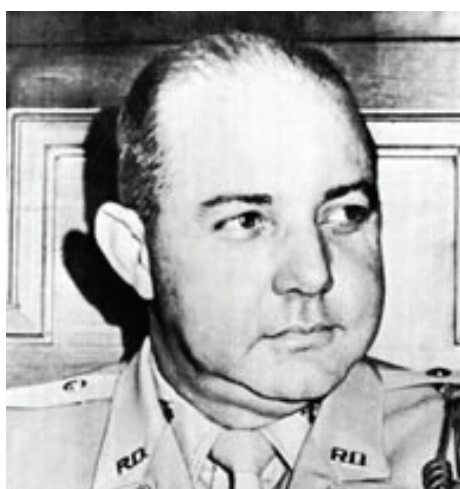
Antonio Imbert Barreras.