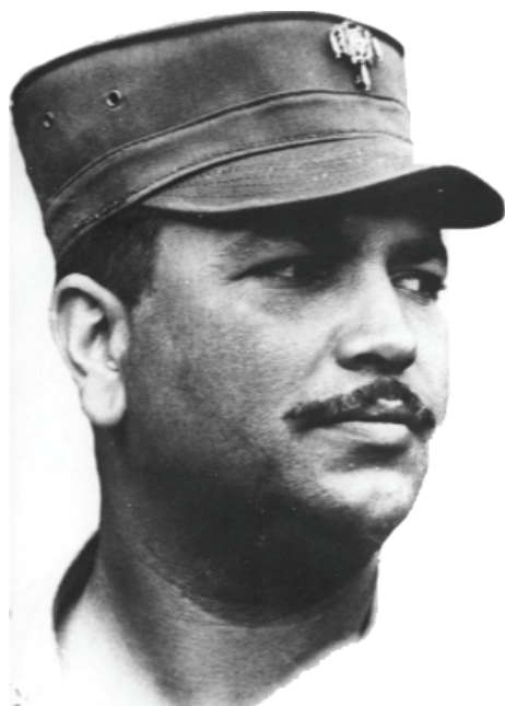
Francisco Alberto Caamaño.