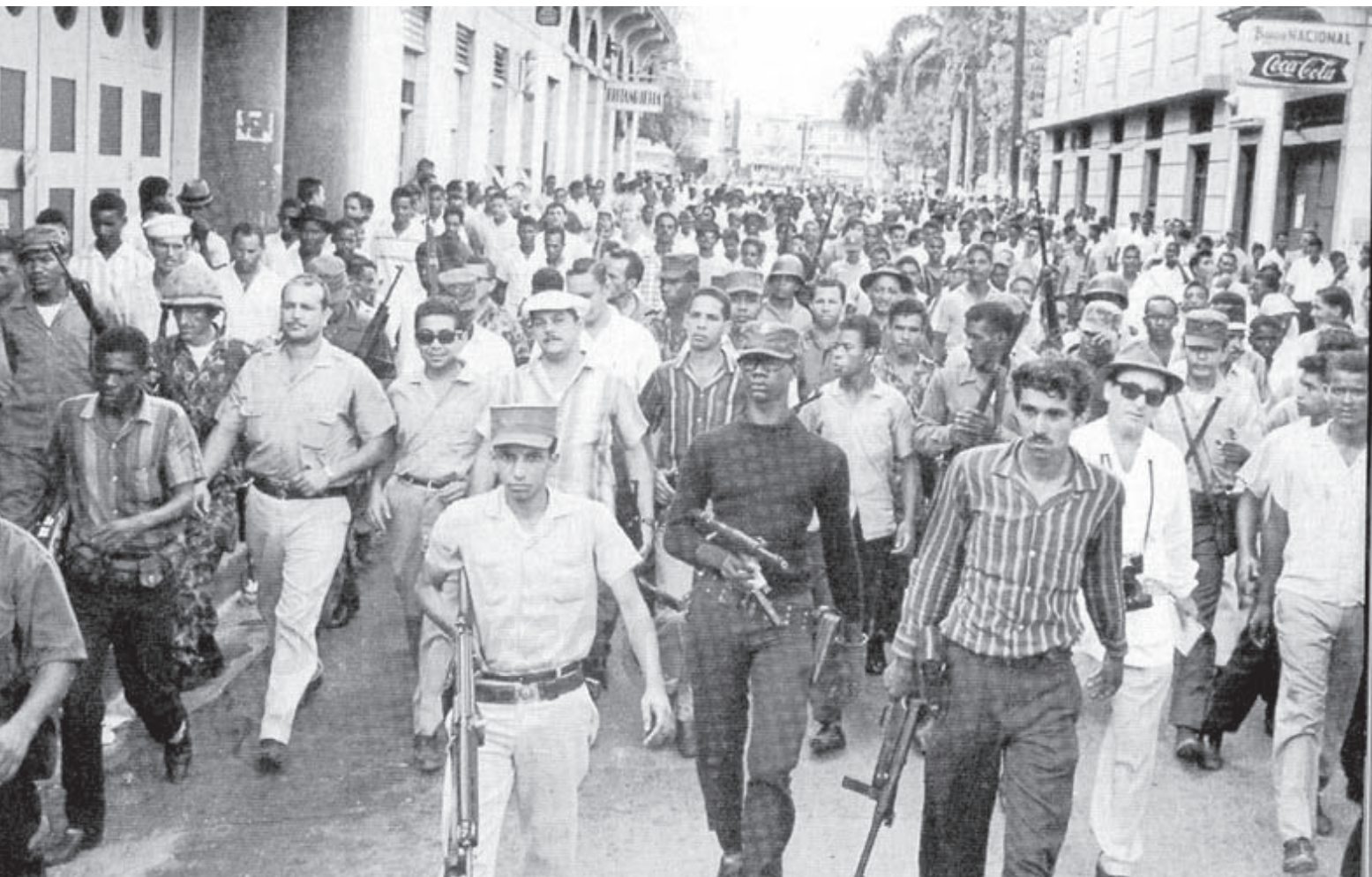
Guerra Civil en 1965.

El coronel Pedro B. Benoit fue el presidente de la Junta Militar integrada por los militares golpistas Elías Wessin y Wessin y Antonio Imbert Barreras. Esta junta con el apoyo del embajador norteamericano William Tapley Bennett fueron la fuerza opositora de la presidencia de Caamaño.