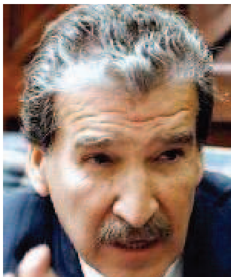
Ramiro de León Carpio.