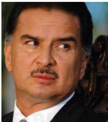
Alfonso Antonio Portillo Cabrera.

En mayo de ese año, se suscribió el “Acuerdo Sobre Aspectos Socioeconómicos y Situación Agraria”, unos meses después el de “Fortalecimiento del Poder Civil Y Función del Ejército en una Sociedad Democrática”. Fue capaz de conseguir la paz en el país con la URNG (guerrilla de Guatemala), luego de más de tres décadas de luchas internas. Tal firma se realizó en un solemne acto el 29 de diciembre de 1996; al cual asistieron Jefes de estado y representantes de otros países, y el Secretario de la ONU. En su mandato la construcción de carreteras e infraestructura, el refuerzo y depuración de las fuerzas de seguridad del país fueron una prioridad. En febrero de 1996, su gobierno recibió la segunda visita del Papa Juan Pablo II.