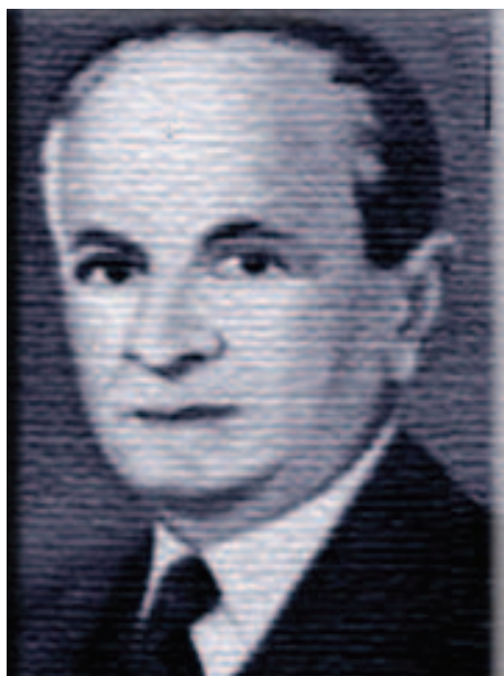
Julio Lozano Díaz.