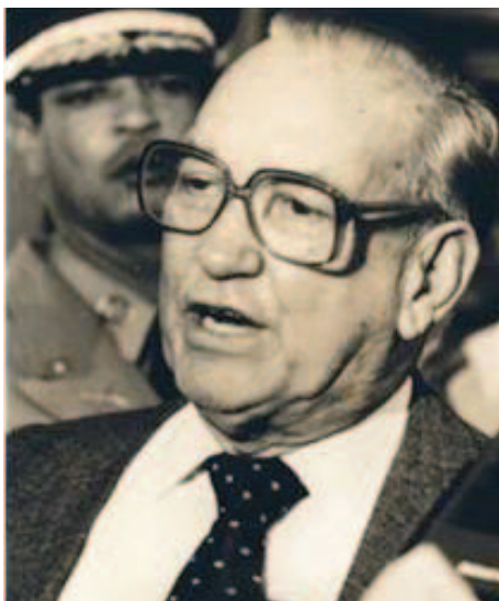
Silvestre Antonio Guzmán Fernández.

A lo largo de su carrera llegó a ocupar el cargo de presidente de la Suprema Corte de Justicia. Cada uno de los cargos públicos que tuvo los realizó sin mayores limitaciones ni presiones. Además su trabajo en el ejercicio público fue aceptado por los diferentes sectores de la política.