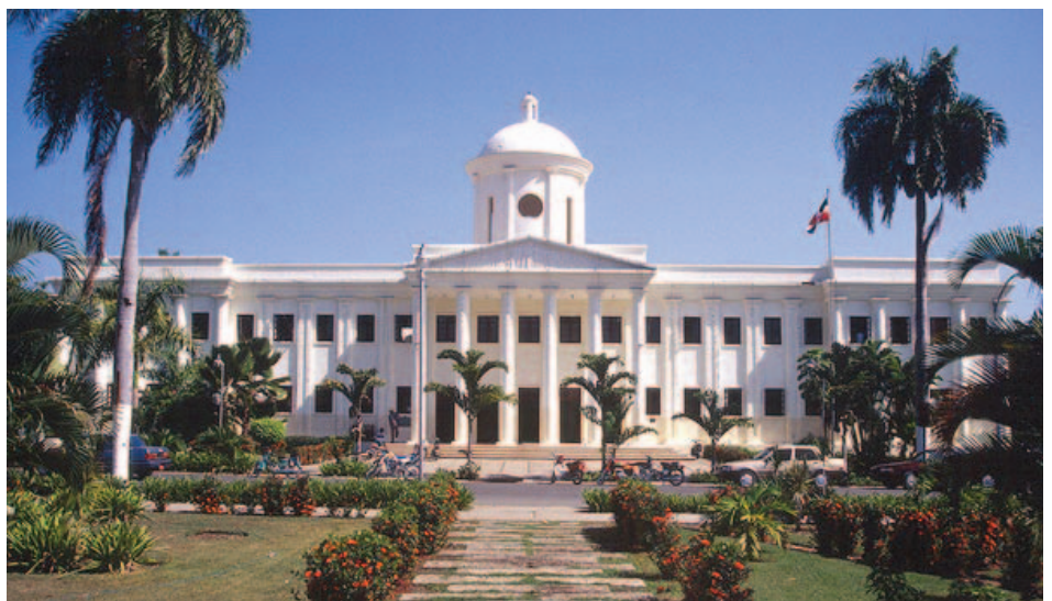
San Juan de la Maguana.