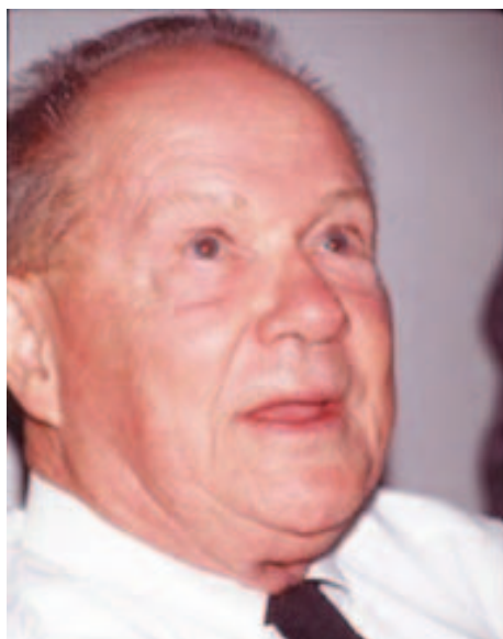
Donald Reid Cabral.

Fue parte del triunvirato que ocupó el lugar de la presidencia cuando se derrocó el gobierno de Juan Bosch en 1963. Ese mismo año tuvo que renunciar de su cargo como consecuencia del asesinato de un grupo de jóvenes combatientes de la agrupación 14 de junio que lideraba Manuel Aurelio Tavárez Justo. Emilio de los Santos no estuvo de acuerdo con aquella matanza, él sólo había ordenado que se reprima.