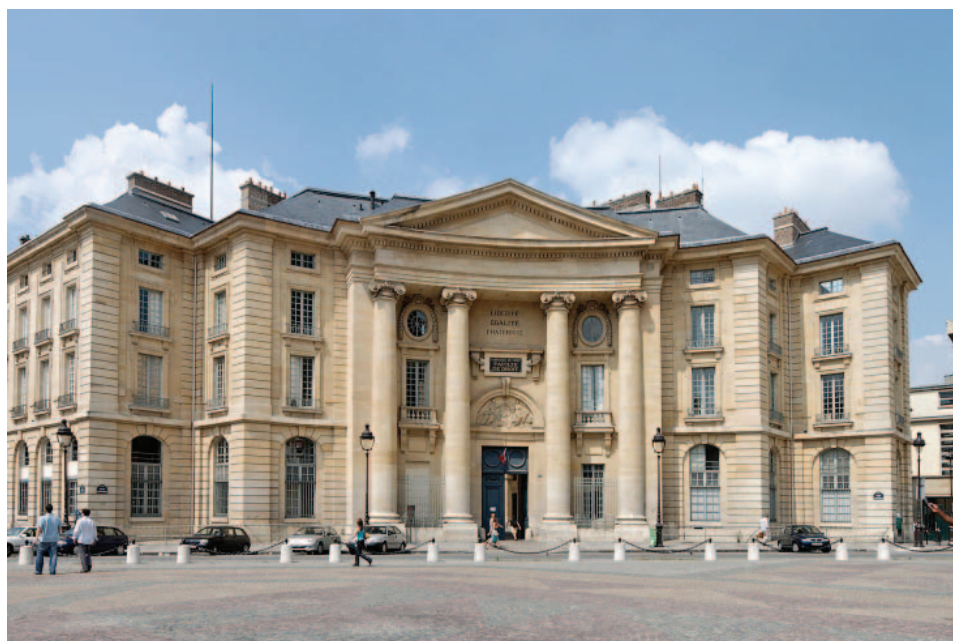
Sorbona de París.