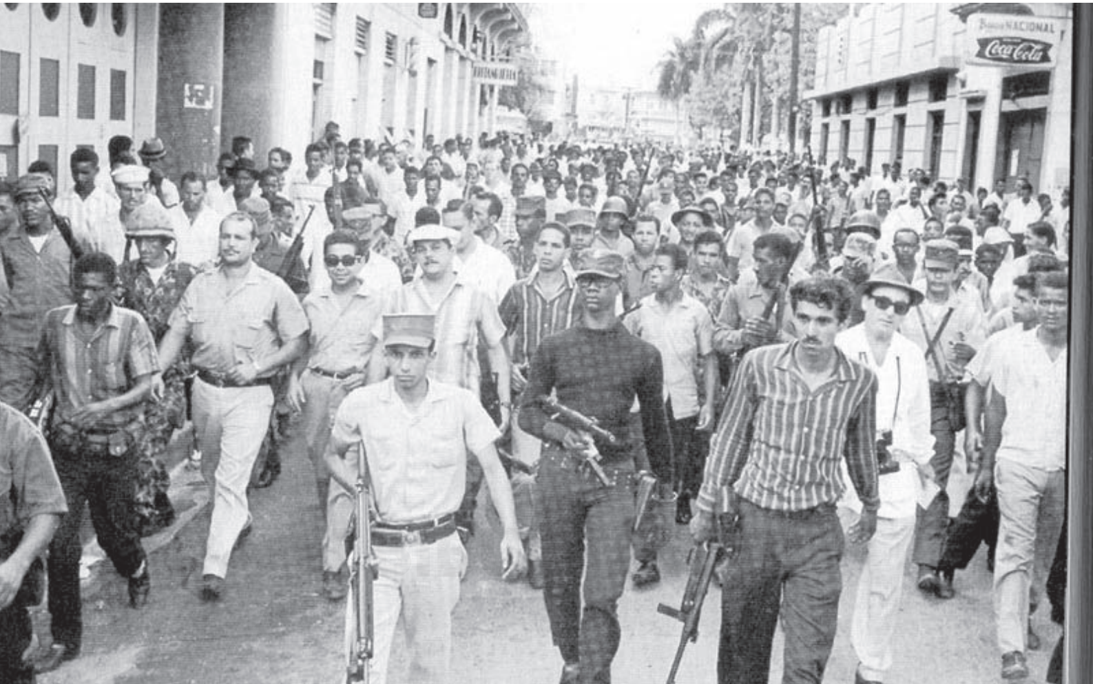
Guerra Civil en 1965.

El coronel Pedro B. Benoit fue el presidente de la Junta Militar integrada por los militares golpistas Elías Wessin y Wessin y Antonio Imbert Barreras. Esta junta con el apoyo del embajador norteamericano William Tapley Bennett fueron la fuerza opositora de la presidencia de Caamaño.