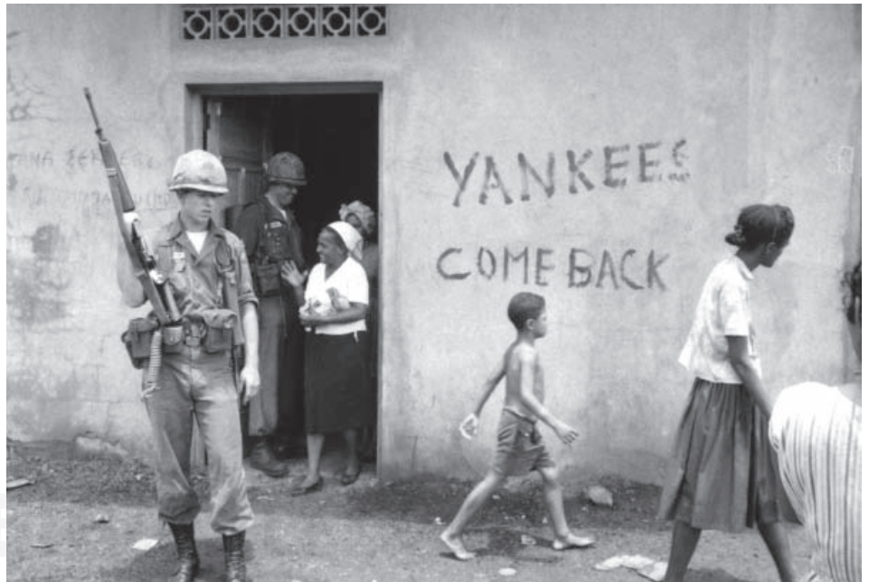
Durante la invasión.