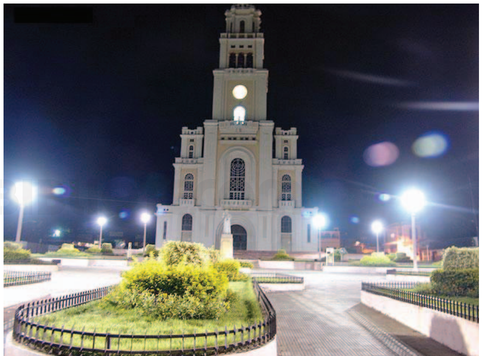
Moca, República Dominicana.

Nació en Moca, provincia Espaillat, República Dominicana en 1921.