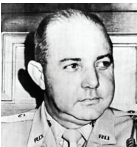
Antonio Imbert Barreras.