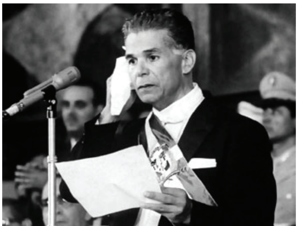
En el Congreso.