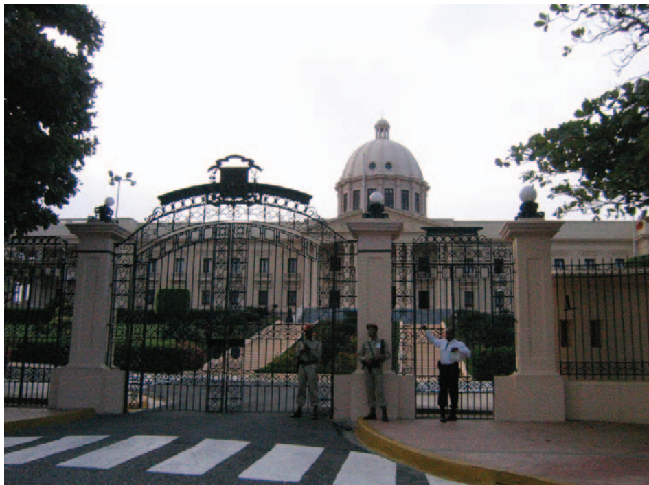
Universidad de Santo Domingo.

Fue parte del triunvirato que ocupó el lugar de la presidencia.