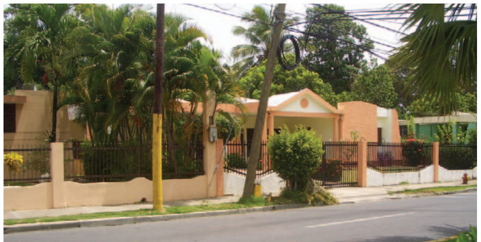
La Vega, República Dominicana.