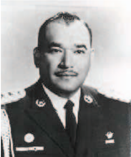
Teniente Coronel Julio Adalberto Rivera.