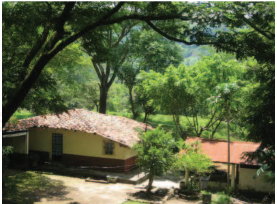
El Divisadero, Morazán.

Entre 1960 y 1962 fue incorporado como militar en la Embajada de El Salvador en Washington. Posteriormente se desempeñó como Ministro del Interior en el gobierno del presidente Julio Adalberto Rivera hasta 1966, fecha en la resultó electo por el partido de Conciliación Nacional para la Presidencia de la República.