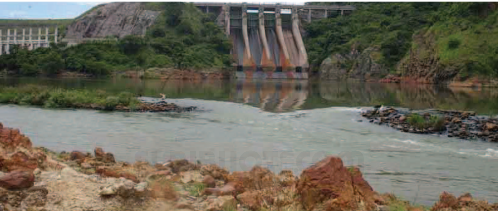
Presa Cerrón Grande.

El gobierno de Arturo Armando Molina coincidió con un período de auge económico que estaba estrictamente relacionado con los precios del café. Esto le permitió lanzar un plan de construcción de infraestructura con el lema “una escuela por día”. De esta manera, se construyeron hospitales y escuelas y la presa hidroeléctrica del Cerrón Grande. En 1976, el presidente Molina propuso implementar un plan de reforma agraria que fue rechazado por los sectores empresariales del país y tuvo que ser abandonado.