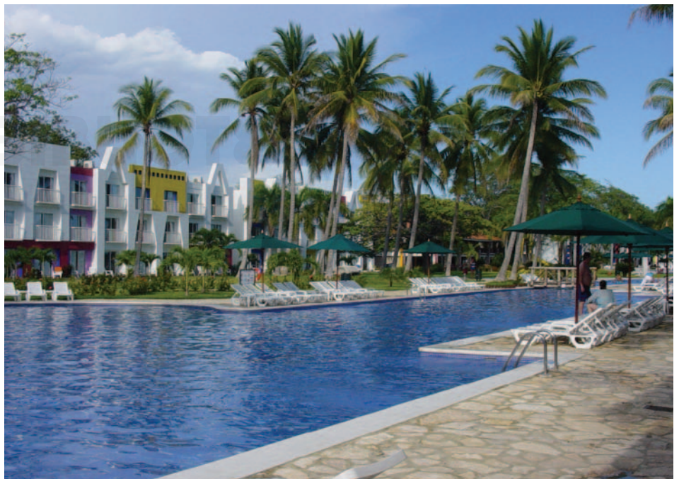
Sonsonate, El Salvador.