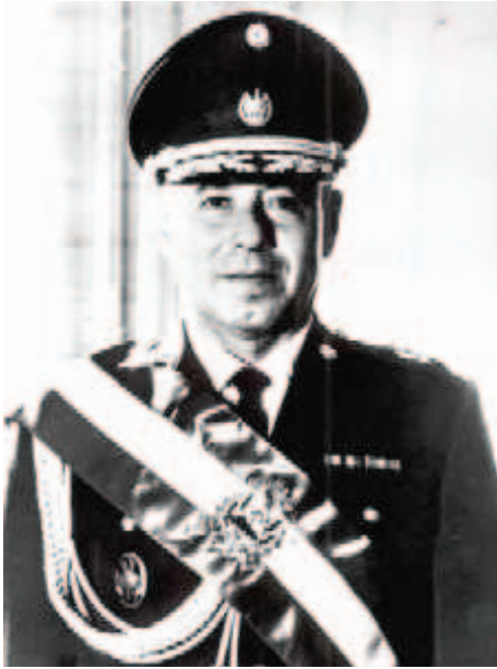
General Fidel Sánchez Hernández.