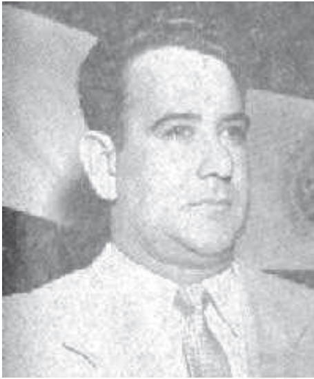
Teniente Coronel José María Lemus.