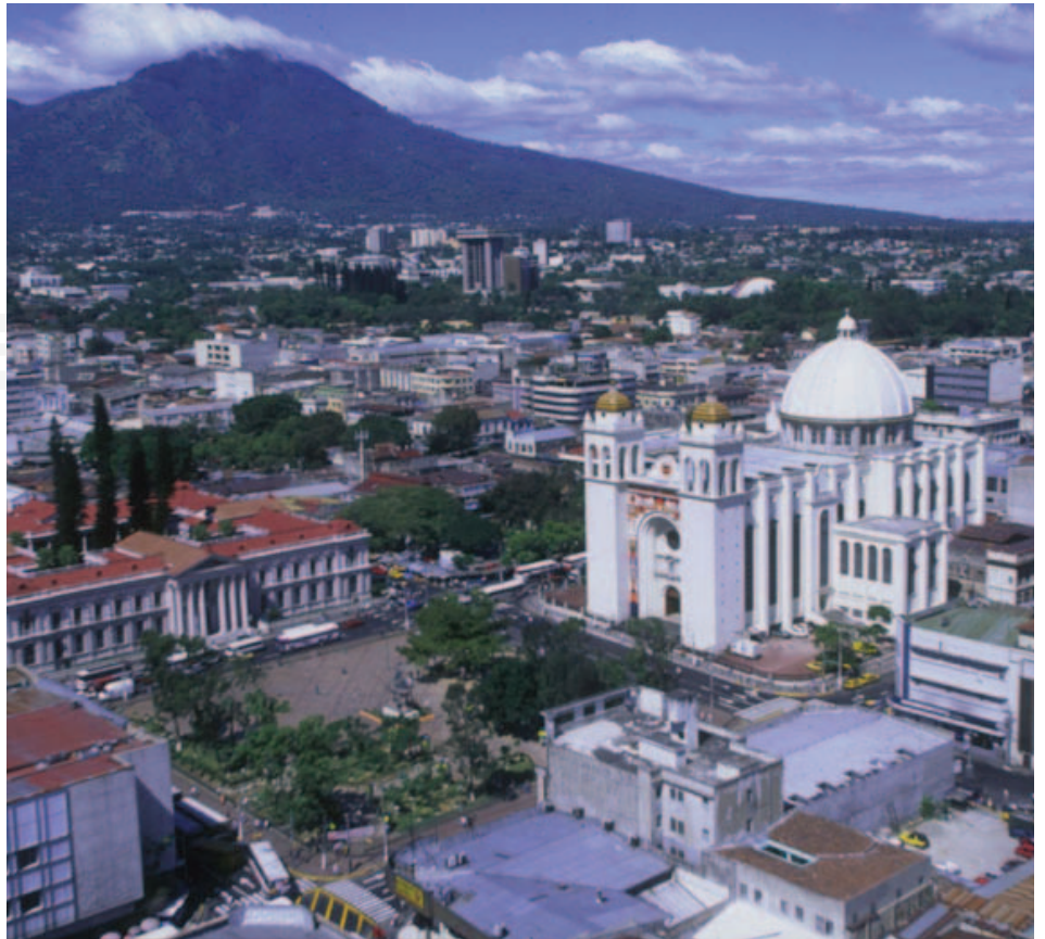
San Salvador, El Salvador.

A los 18 años ingresó en la Escuela Militar de la cual egresó como subteniente de Infantería en 1949. A partir de entonces, comenzó con su carrera militar hasta llegar al grado de coronel en 1969. Al mismo tiempo, se desempeñó fue miembro del consejo de admón del Ferrocarril de El salvador desde 1962 hasta 1964. Al dejar este puesto fue Director de la comisión Ejecutiva Portuaria Autónoma de Acajutla, de 1964 a 1968 y delegado de este organismo para visitas a instalaciones portuarias en varios países del norte, centro y sur América.