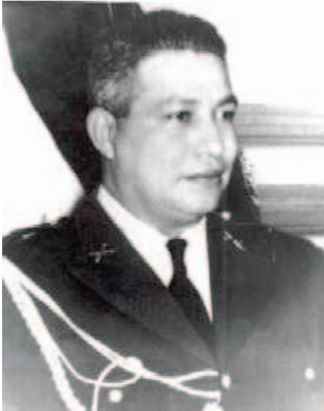
Teniente Coronel Oscar Osorio.