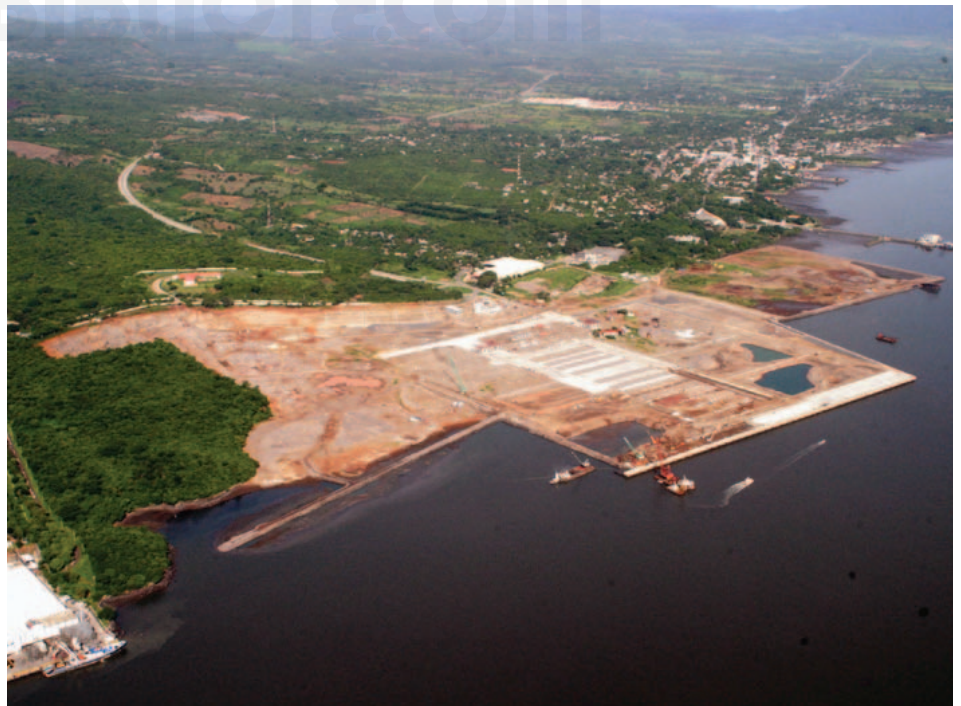
Puerto La Unión.

Se desempeñó como Ministro del Interior de 1949 a 1955. Dos años más tarde fue elegido presidente de la República, cargo que conservó hasta 1960. Su gobierno se vio imposibilitado de continuar con las política de moderada reforma social del anterior presidente Óscar Osorio dado que el panorama económico había cambiado. Se registró una fuerte caída del valor del café lo que conllevó a protestas y movimientos populares.