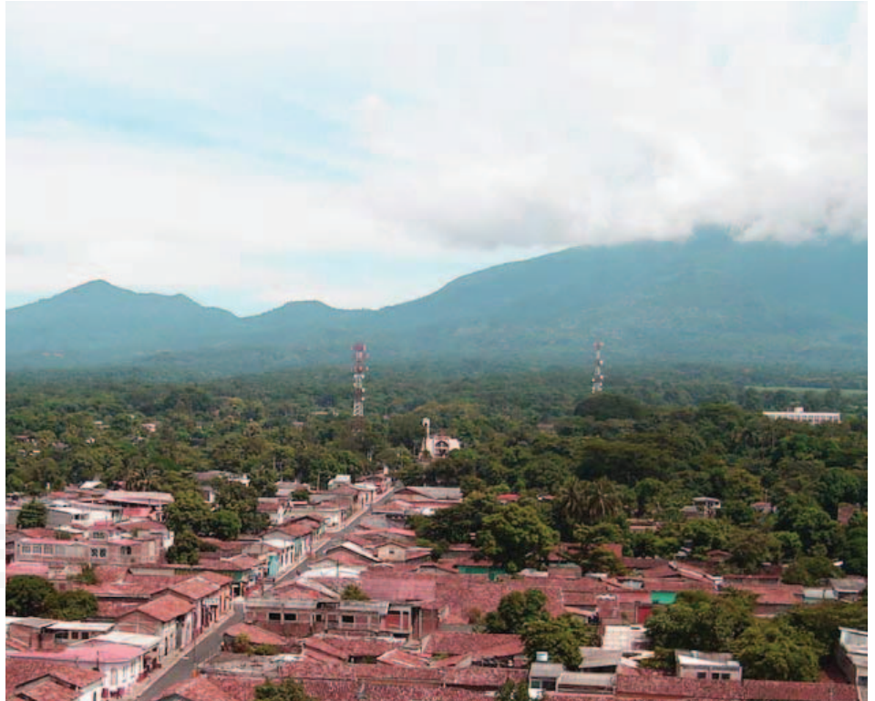
Zacatecolucas, El Salvador.

En la localidad de Zacatecoluca del Departamento de La Paz nació el Teniente Coronel Julio Adalberto Rivera el 2 de septiembre de 1921. Se desempeñó como militar y político llegando a ser, en 1961, fundador del Partido de Conciliación Nacional y, en 1962, presidente de la república.