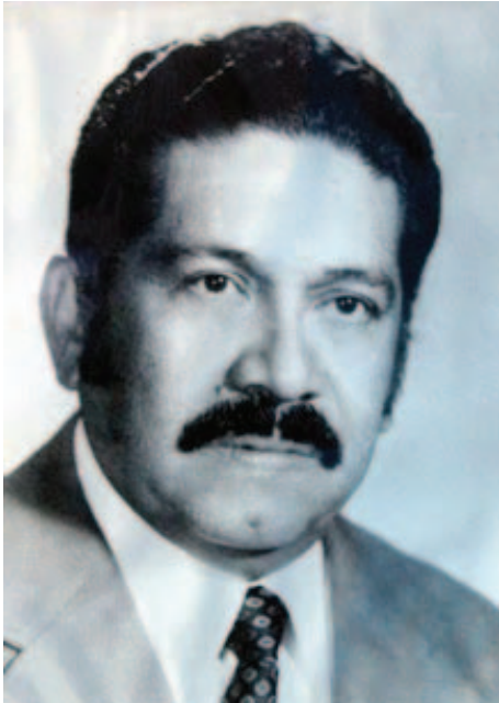
Coronel Arturo Armando Molina.