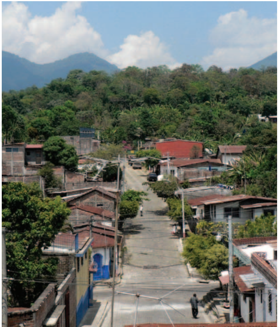
Juayúa, El Salvador.