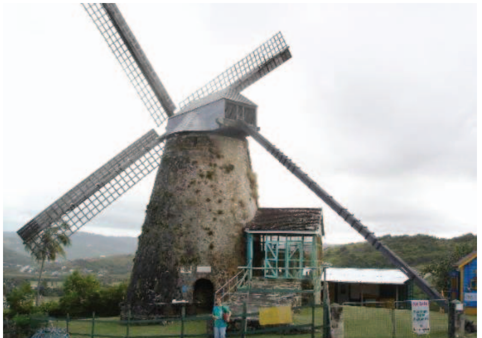
Morgan Lewis Plantation.

Nació el 5 de agosto de 1926 en Morgan Lewis Plantation. Los estudios primarios los cursó en a Escuela Elemental Selah en Santa Lucia entre 1931 y 1936. Los grados de la secundaria los realizó en la Escuela Parry en el Harricon entre 1936 a 1946. Fue maestro en la Escuela Parry durante tres años.