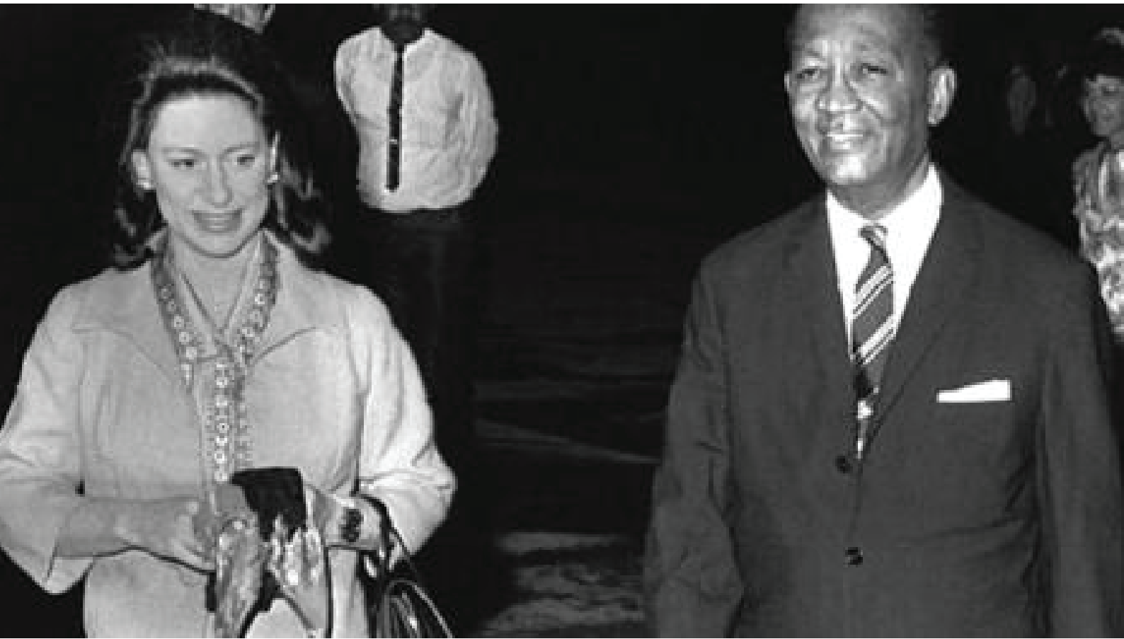
Junto a la princesa Margaret.

Con respecto a su carrera profesional como médico, uno de sus mayores logros fue abrir su propia clínica "Woodside Memorial" que se dedicaba a hospedar ancianos. Su carrera como médico se vio interrumpida en 1967 cuando ocupó el cargo de Gobernador General.