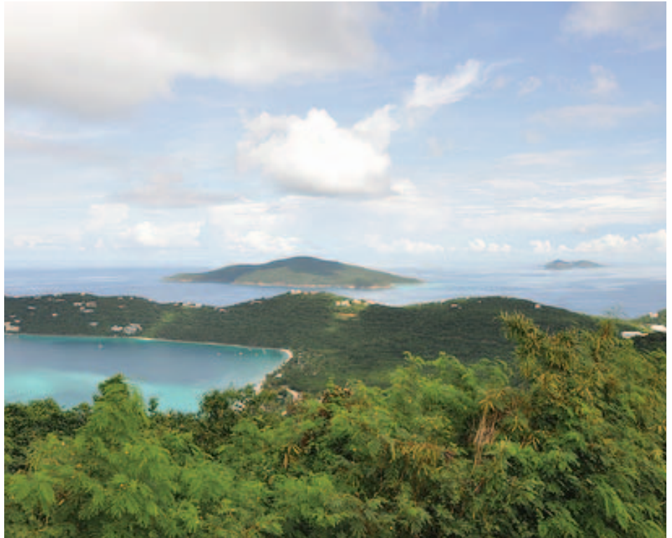
Santa Lucía, Barbados.

En 1950, retornó a Barbos y se convirtió en miembro del Partido Laborista de Barbados (BLP) en 1951. Obtuvo victoria en los escaños de ese año en la Cámara de la Asamblea, donde llegó a ser mayoría su partido.