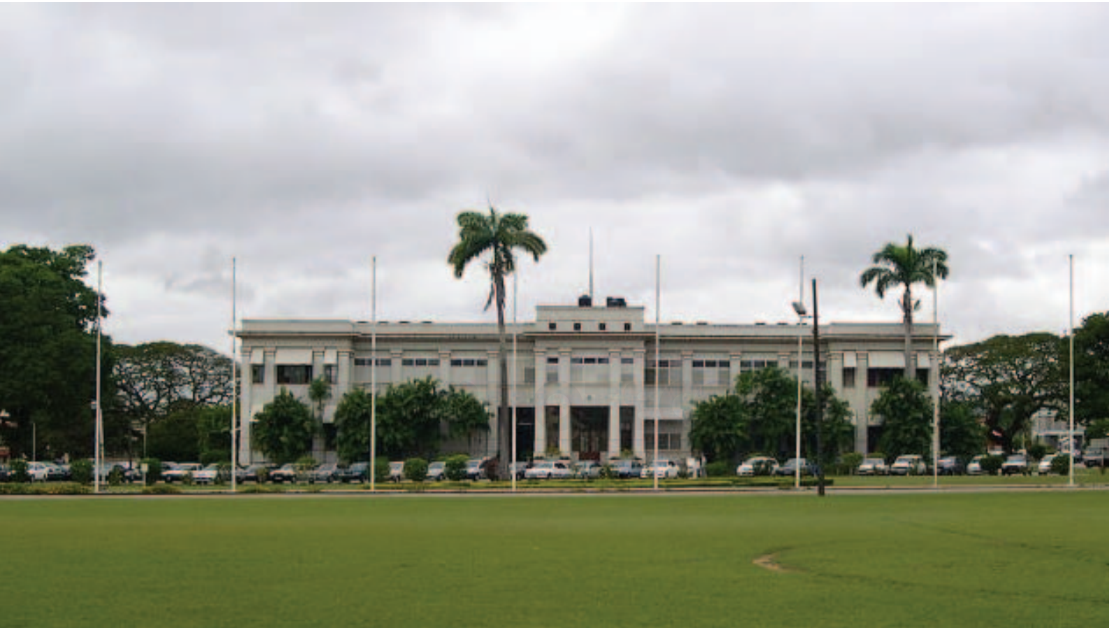
West Indies University.

Sus habilidades administrativas beneficiaron la Liga Progresista, en la misma se desempeñó como Secretario General y creo una sección económica de registros. En 1944, fue nombrado miembro del Comité Ejecutivo.