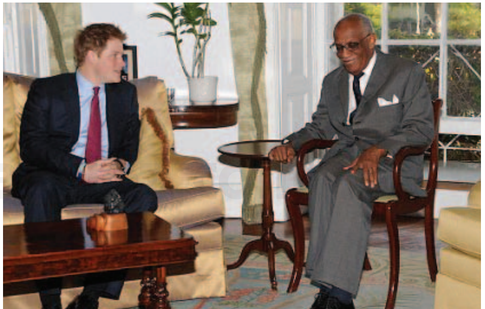
Junto al príncipe Harry.

Lo nombraron Juez de la Corte Suprema en 1976 y en 1991 fue promovido al rango de Juez de Apelación. También actuó como Presidente del Tribunal Supremo en varias ocasiones y como Gobernador General.