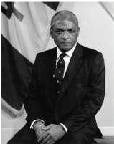
Sir Hugh Springer.

Entre 1976 y 1984 Deighton Ward ocupó el cargo de Gobernador General. Fue nombrado Caballero de la Grand Cross de la Orden Real Victoriana y también fue Caballero de Saint Michael y Saint George.