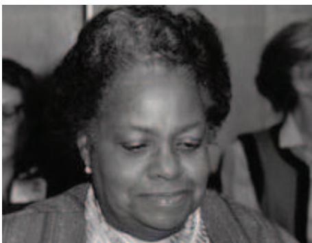
Dame Nita Barrow.

En 1946, se hizo responsable de la educación, del Departamento Jurídico, de la Agricultura y la Pesca. En 1947 renunció de la Liga y asumió funciones como Secretario de la Universidad de West Indies en Jamaica.